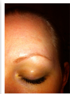
Direkt efter behandling